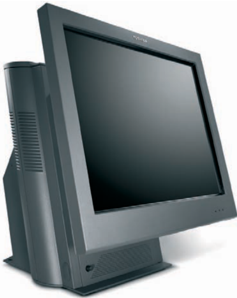
Figura: Toshiba SurePOS 500 modello 566