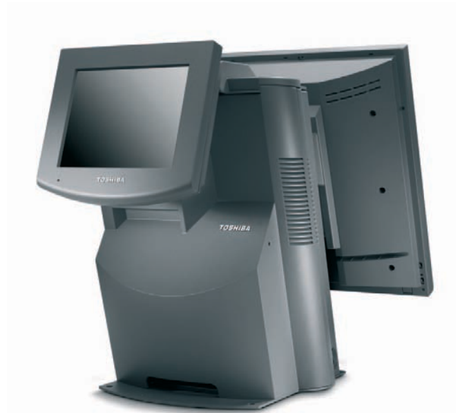
Figura: Il display indipendente consultabile dal cliente (LCD VGA 6.5) fornisce informazioni e merchandising digitale multimediale (opzionale)